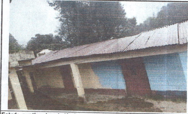
Foto 1: sustitución de lámina, por lamina troquelada aluzinc calibre 26